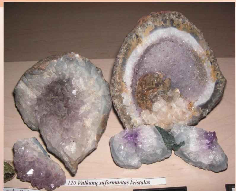
120 Vulkanų suformuotas kristalas