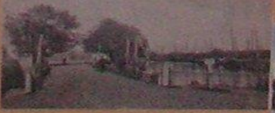
Talpaus patalpinimo Klaipėdos girlianos istorija ir dabar.