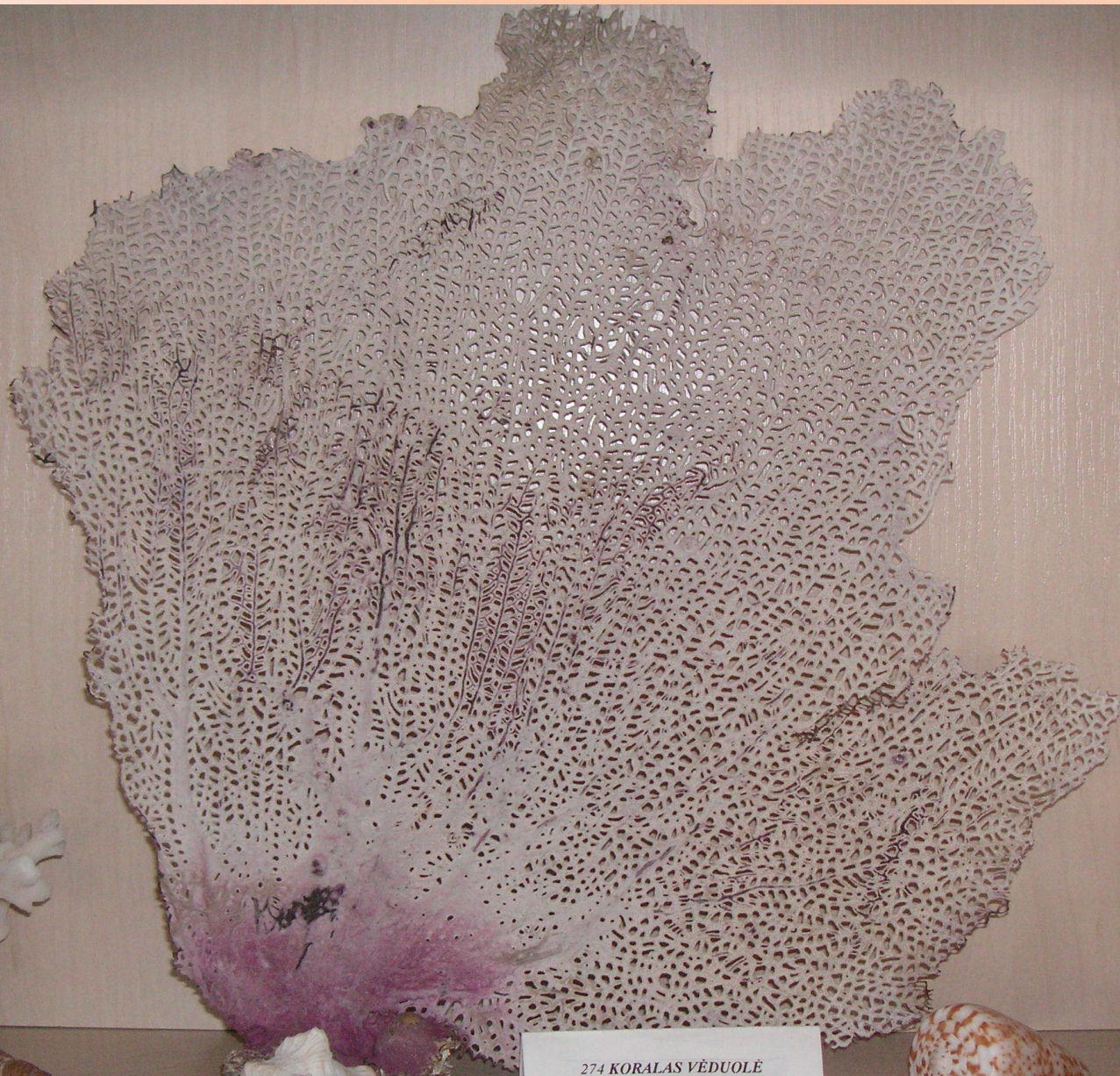
274 KORALAS VĖDUOLĖ (Raudonoji)