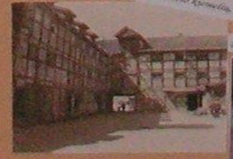
Dabar tai „Klaipėdos Kultūrinis komunikacijos centras“