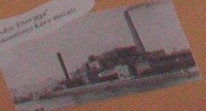
UAB „Klaipėdos Energetika“ antrasis pasaulinis karo metais