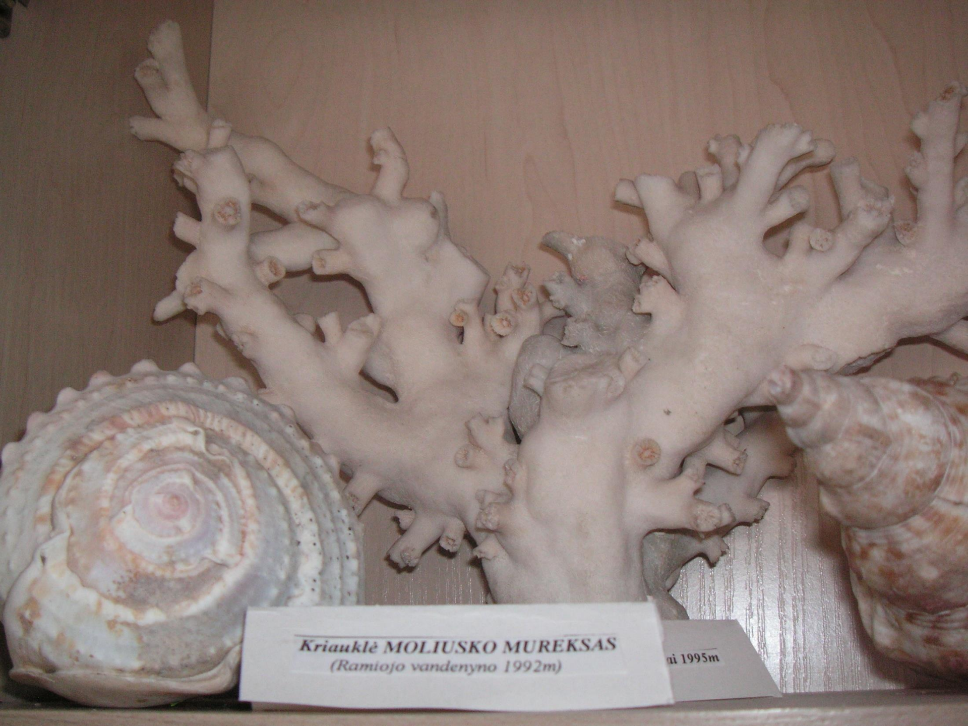
Kriauklė MOLIUSKO MUREKSAS (Ramiojo vandenyno 1992m)