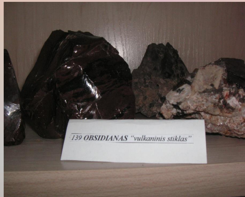
139 OBSIDIANAS "vulkaninis stiklas"