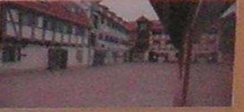
Dabar tai „Klaipėdos Kultūrinis komunikacijos centras“